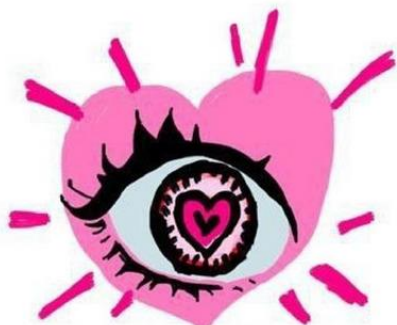
Perfectly Splendid - SVA