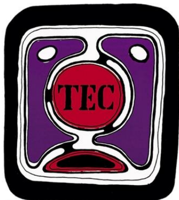
TEC - TEATRO EXPERIMENTAL DE CASCAIS

(591) Pantone 185C;Pantone Black 6C;Pantone 2613C;Pantone 663C; (540)