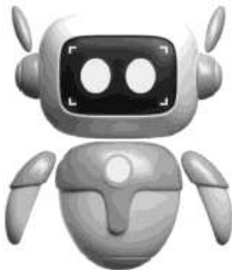
AI TRAVEL AGENT