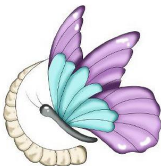
METAMORFOSE ARTE E EDUCAÇÃO

(531) 3.13.1 ; 3.13.18 ; 27.5.10 ; 29.1.4 ; 29.1.99